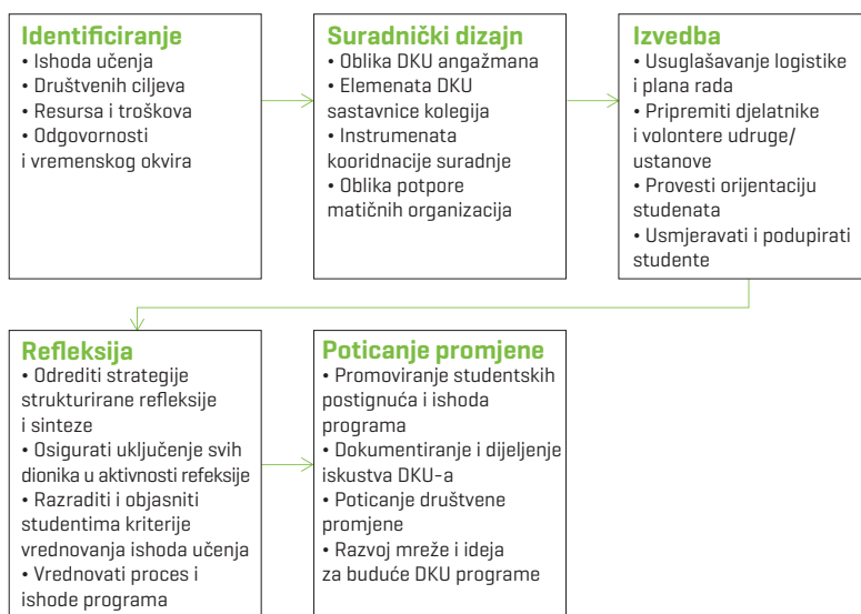
Slika 2. I CARE model društveno korisnog učenja